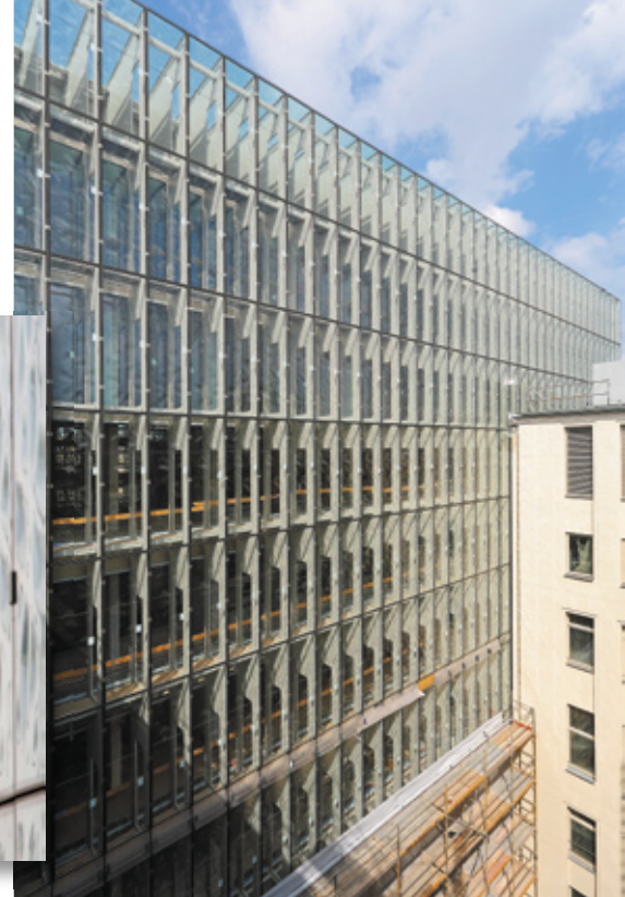
Mit der grossen Fensterfront lässt sich das Tageslicht optimal nutzen.

Massgeschneiderte Beleuchtung mit Tages- und Kunstlicht