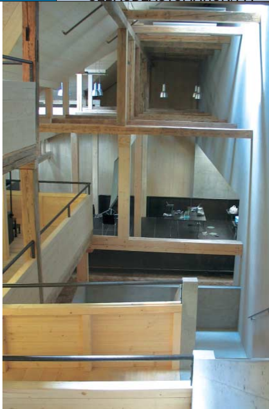
Bild 2: Das neuentstandene Gebäude besticht durch seine geschickte Kombination von alten mit neuen Elementen.

Die gesamten HLKKS-Anlagen werden über drei Saia-SPS PCD2.M150 gesteuert und geregelt. Über SPS und Bettschen I/O-Module mit integrierter Notbedienung sind ca. 350 Datenpunkte angeschlossen. Für die Vortbedienungen stehen drei Bedienterminals PC7.D795 zur Verfügung. Die SPS der verschiedenen Anlagen sind über Ethernet vernetzt. Die einzelnen Steuerungen laufen auch bei Ausfall der Ethernet-Kommunikation autonom.