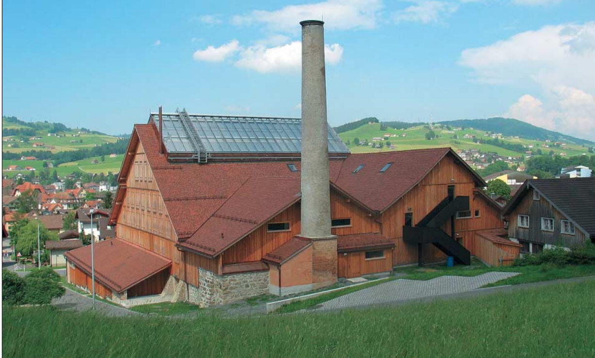
Bild 1: Die Kunsthalle Ziegelhütte: Alte Hülle, High Tech im Innern.