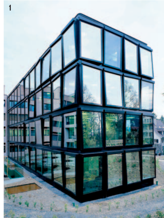
Bild 1 Projekt Helvetia Patria Versicherung, Hauptsitz St. Gallen: umfangreiche Gebäudeautomation für Minergie-Standard.

Eine weitere Parallele: In Theater und Film wird die Fiktion so dargestellt, dass sie als Realität erscheint. Dann sind die Zuschauer im Bann und erleben intensive Gefühle! Fast ähnliche Eigenschaften weist ein integraler Test mit Drehbuch auf: Die Anlagen